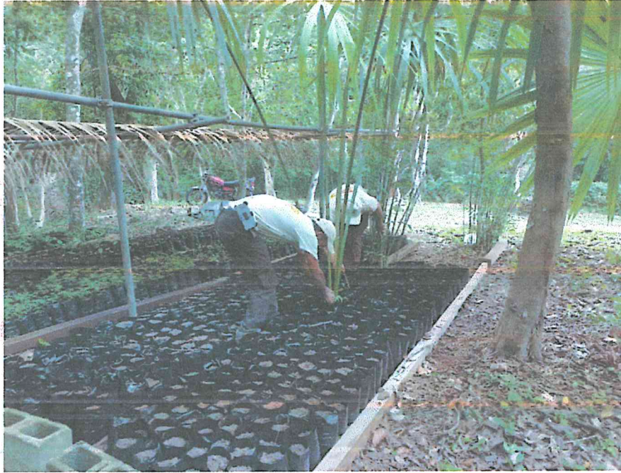
Fig.6: Vivero para la recuperación de áreas degradadas