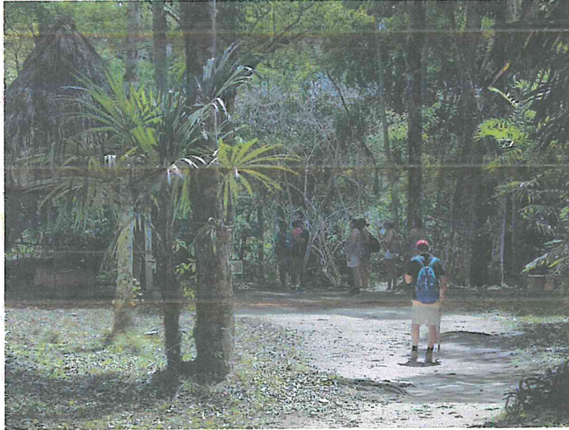
Fig.3: Atención de visitantes en zona de uso público

Se realizan recorridos para observar las actividades de visita en la zona de uso público del Parque, el comportamiento de los visitantes y el trabajo del grupo de vigilancia.