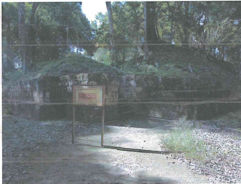
Fig.4: Revisión de rótulación

Se ha seguido revisando la propuesta de renovación de la rotulación de los principales sitios arqueológicos del Parque y los caminos de acceso.